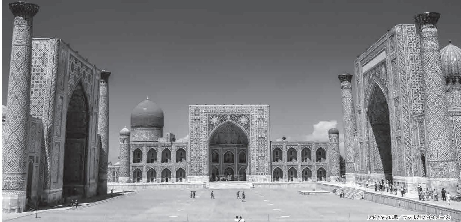
レジスタン広場/サマルカンド(イメージ)