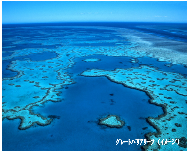
グレートバリアリーフ（イメージ）