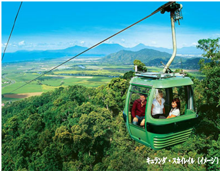
キュランダ・スカイル（イメージ）