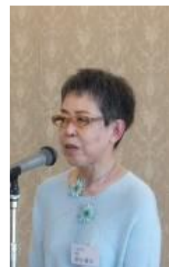
挨拶される黒田支部長